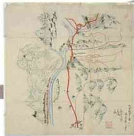
戊辰戦争の図 (角石原)