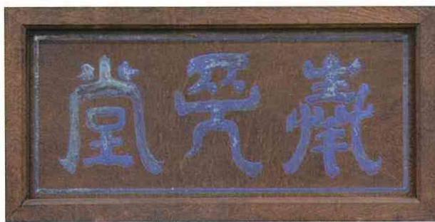
奉先堂扁額 (豊田神社所蔵)