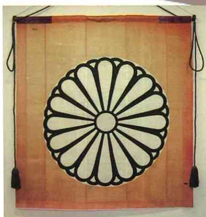
菊花紋章四方旗 (豊田神社所蔵)